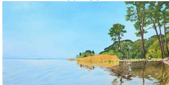
Lac de Cazaux - 65x130