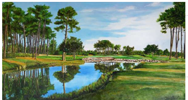
Le golf du Gujan, le matin - 50x91