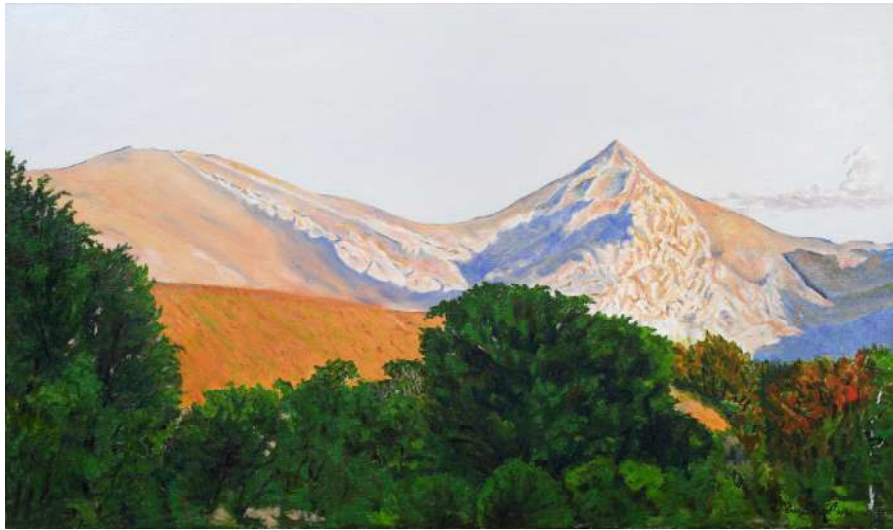
Soleil couchant sur le Pic Behorleguy - 55x90