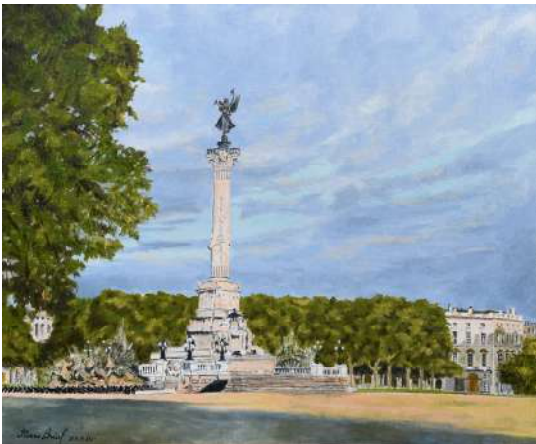
La colonne des Girondins - 60x73