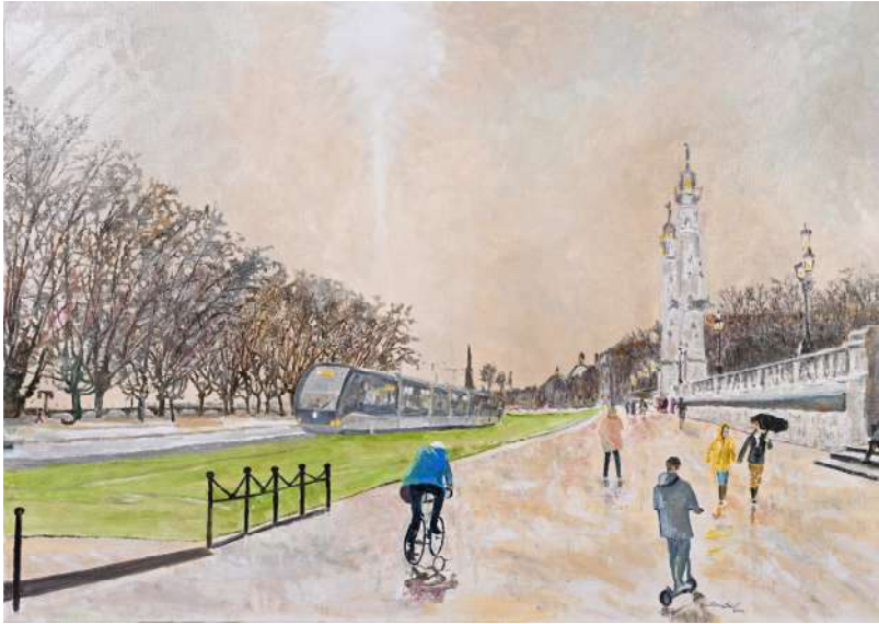
Quai Louis XVIII sous la pluie - 65x92