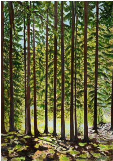
Les Mélèzes après le chalet Pedro - 92x65