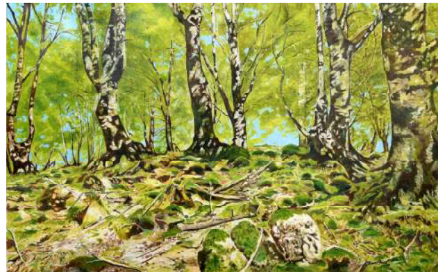
Forêt de hêtres nouveaux - 81x130