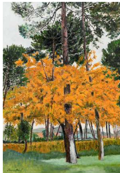
Au fond du bassin- 60x42