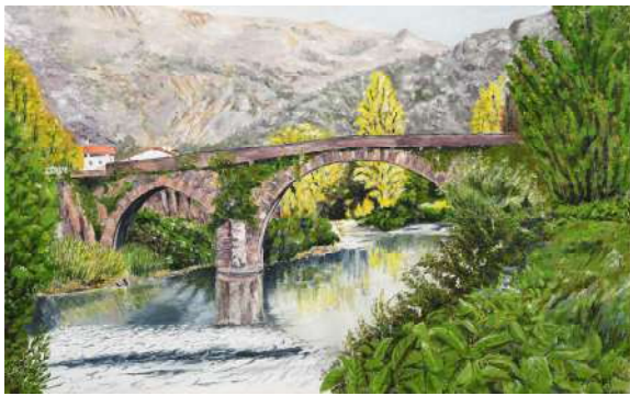
Pont Noblia, Bidarray - 38x61