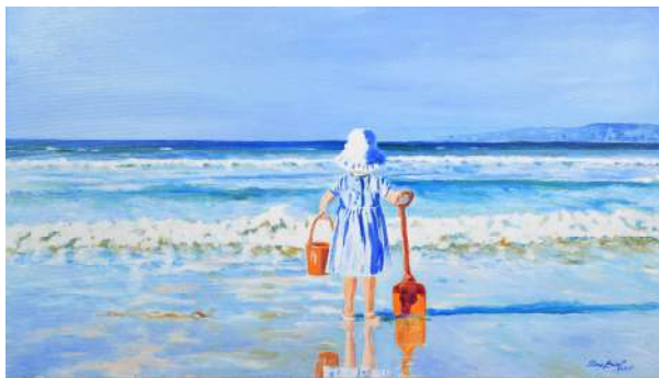
Anna et l'Océan - 54x75