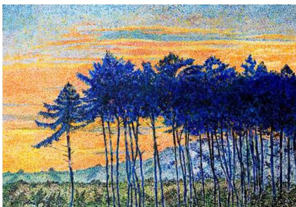
Landes du côté de Magesq - 41x60