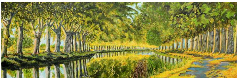
Canal du Midi - 50x150