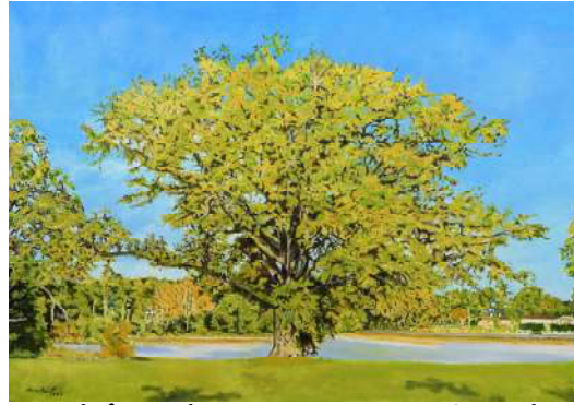
Le chêne, la Bergerie Nationale 80x130