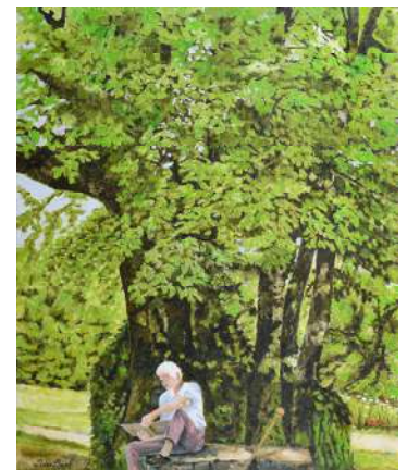
Le pèlerin sur la route de Saint Jacques - 73x60