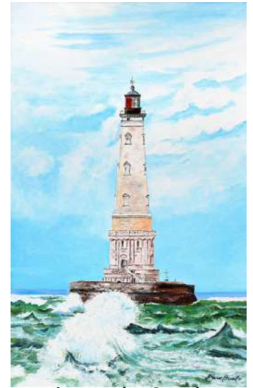
Le phare de Cordouan 61x38