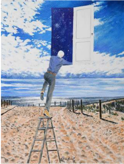
L'homme qui cherchait les étoiles - 61x46