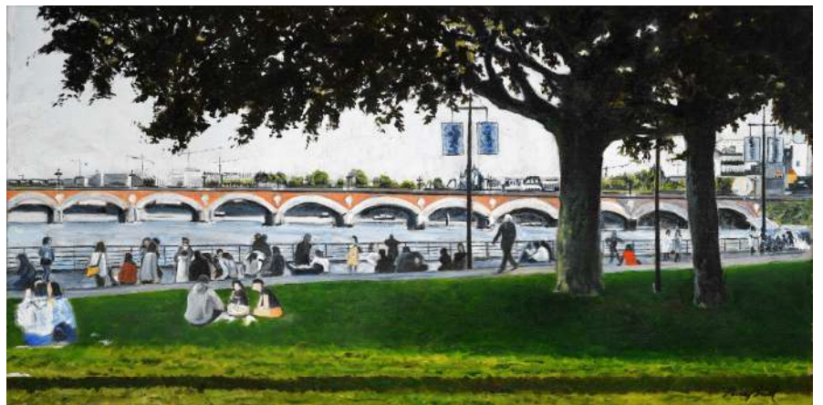
Bordeaux aujourd'hui - 40x80 Collection particulière