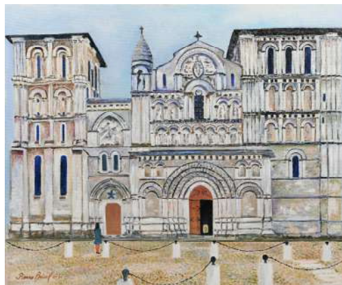
Abbatiale Ste Croix - 60x73